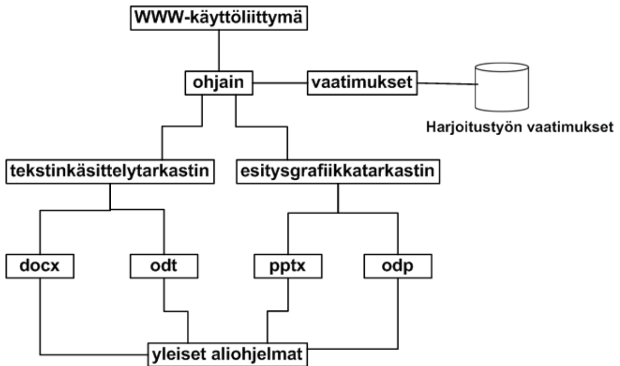
Kuva 5: Sovelluksen rakenne.

Sovelluksen rakenne on kuvan 5 mukaisesti kerroksellinen. Kuvassa esitetään yksinkertaisuuden vuoksi vain tekstinkäsittely- ja esitysgrafiikkatarkastimet.