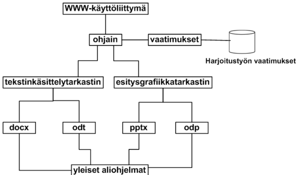
Kuva 5: Sovelluksen rakenne.

Sovelluksen rakenne on kuvan 5 mukaisesti kerroksellinen. Kuvassa esitetään yksinkertaisuuden vuoksi vain tekstinkäsittely- ja esitysgrafiikkatarkastimet.