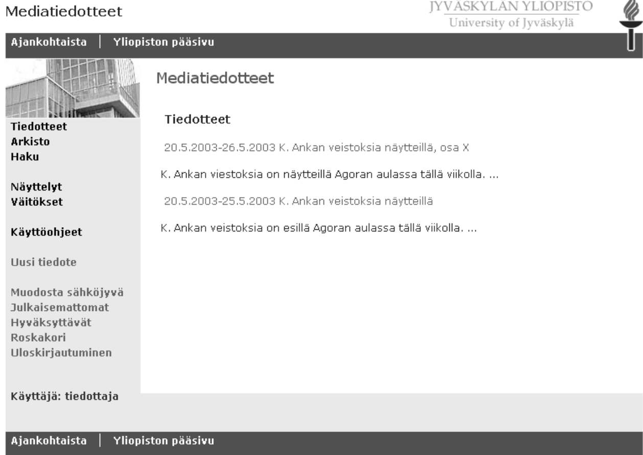
Kuva 3. Mediatiedotteet -etusivu.

Kuvassa 3 on esitetty Mediatiedotteet -sivuston etusivu. Linkkeihin tehtävät muutokset näkyvät ala- ja yläpalkeissa ( Yliopiston pääsivu ) sekä vasemman reunan linkkilistassa ( Sisäänkirjautuminen ja Uloskirjautuminen ).