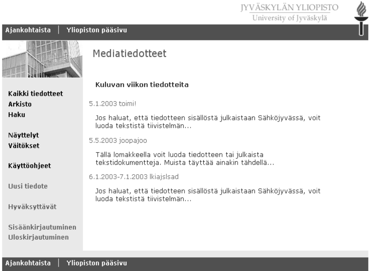
Kuva 3. Mediatiedotteet -etusivu.

Kuvassa 3 on esitetty Mediatiedotteet -sivuston etusivu. Linkkeihin tehtävät muutokset näkyvät ala- ja yläpalkeissa ( Yliopiston pääsivu ) sekä vasemman reunan linkkilistassa ( Sisäänkirjautuminen ja Uloskirjautuminen ).